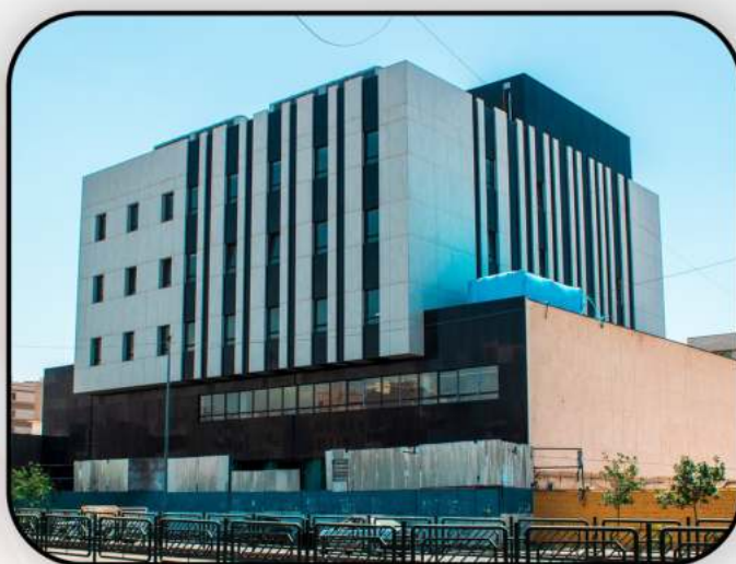
بیمارستان آتیه ۲