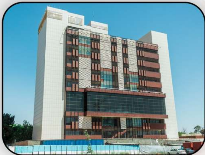
بیمارستان توانبخشی مینا